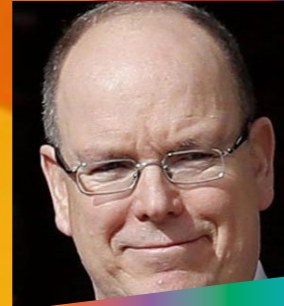
Prens Albert Monaco Prensi