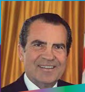
Richard Nixon ABD Eski Başkanı