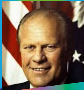
Gerald Ford ABD Eski Başkanı