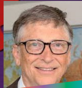
Bill Gates Microsoft Kurucusu