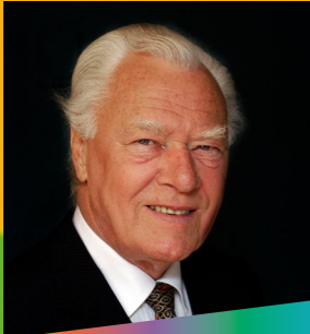
Paul Schülter Danimarka Eski Başbakanı