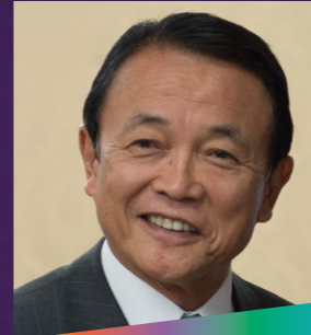
Taro Aso Japonya Eski Başbakanı