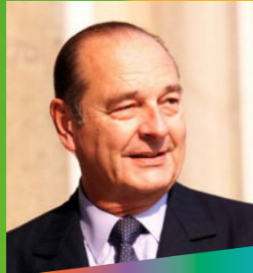
Jacques Chirac Fransa Eski Cumhurbaşkanı